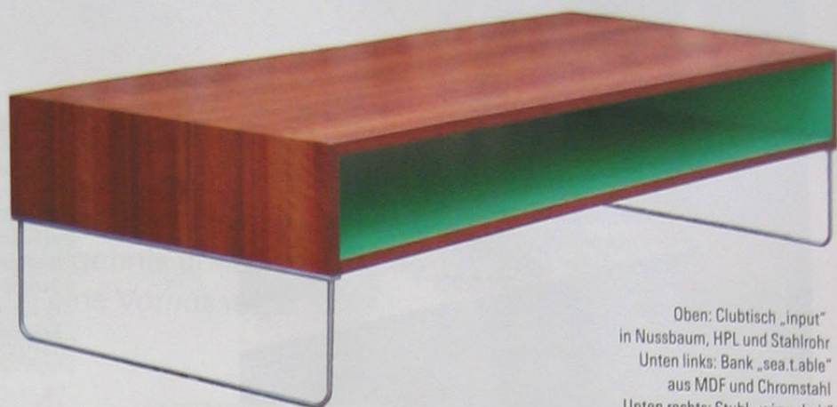
Oben: Cluhtisch „input“ in Nussbaum, HPL und Stahlrohr Unten links: Bank „sea.table“ aus MDF und Chromstahl Unten rechts: Stuhl „wing chair“ aus lackiertem Aluminium