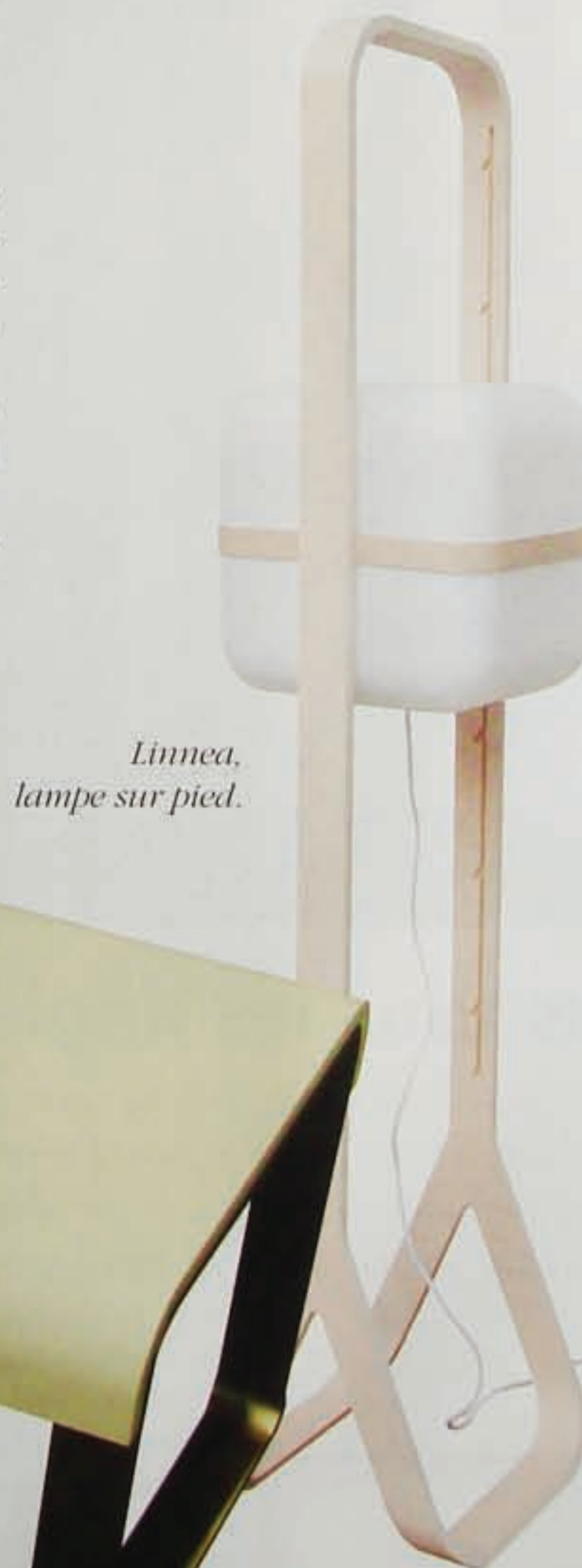
Linnea, lampe sur pied.